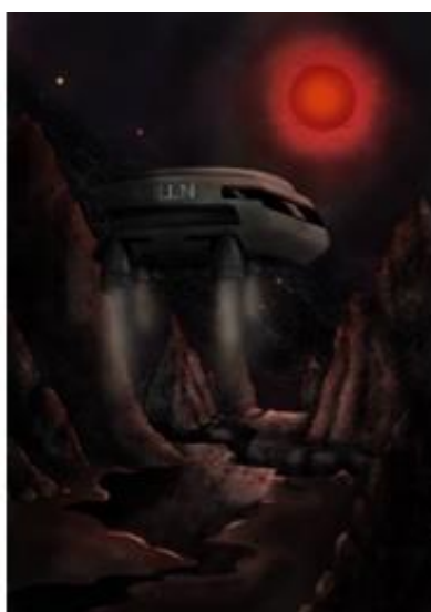
Proxima Centauri b - U.N. intervention av Katja Lindblom.