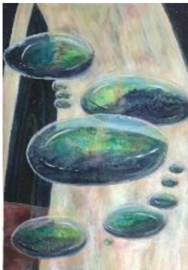
Offspring av Camilla Centerwall.