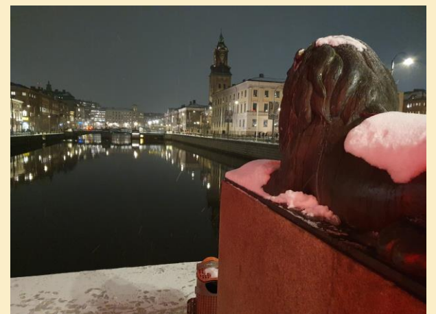
Ett snöigt Göteborg under december. Cosmoiterna träffades som många gånger tidigare vid Lejontrappan.

Under träffen tändes också tomtebluss och den nya Dunefilmen diskuterades och kontrasterades mot den tidigare filmatiseringen.