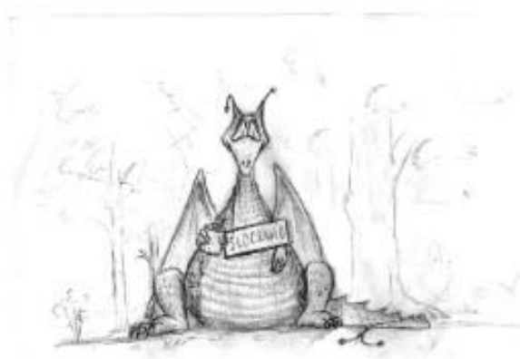
Slocknad av Lars-Göran Johansson.