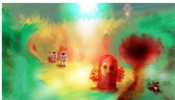
Spirougraf av Alf Rynefors.