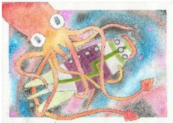
Green Elf X-6001 av Nelly Floryd.