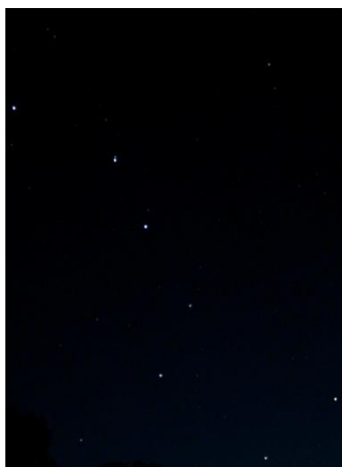
Karlavagnen är den pilbåge som Favdna använder i sin jakt.