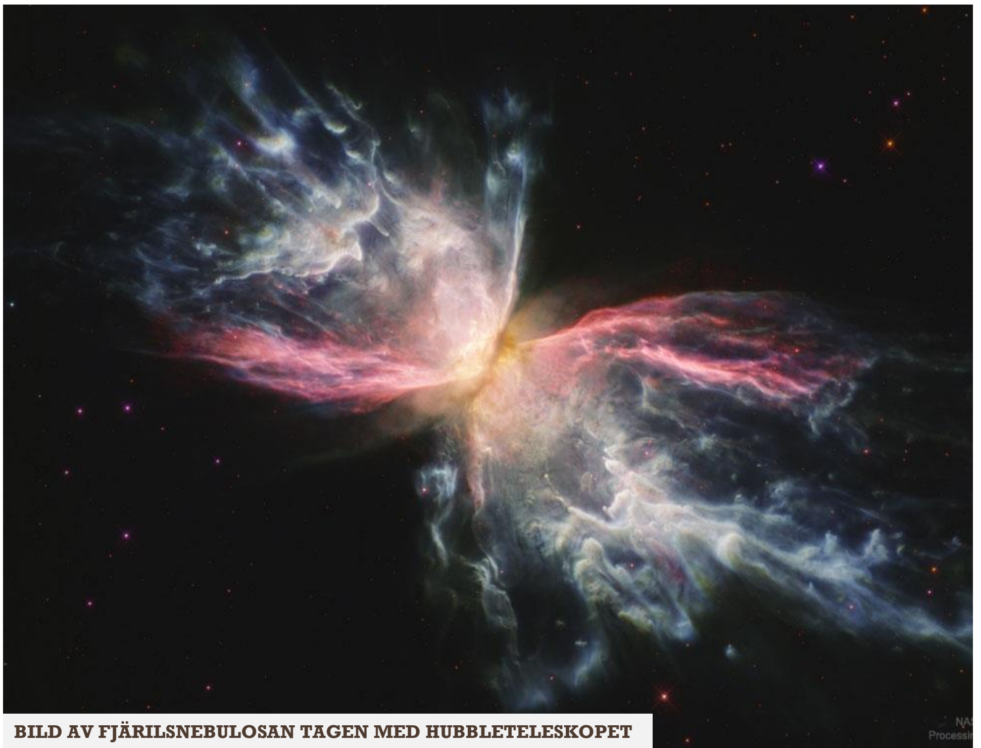
BILD AV FJÄRILSNEBULOSAN TAGEN MED HUBBLETELESKOPET

Se även: https://www.spacetelescope.org/news/heic0407/