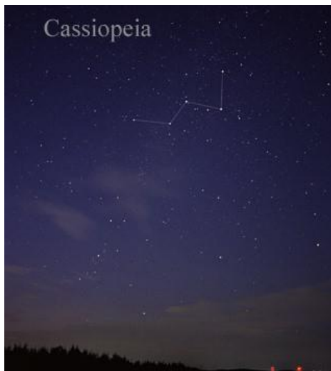
De fem stjärnorna i Cassiopeja utgör hornen på älgturen som springer över himlavalvet.

https://www.popularastronomi.se/wp-content/uploads/2013/06/AT1998_3_radbo.pdf